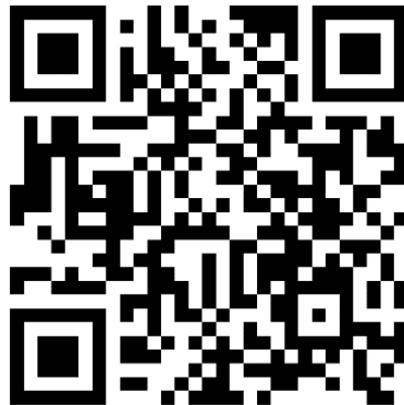
QR code สำหรับจอง ATK